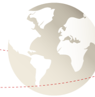
Table Ronde Energie Solaire